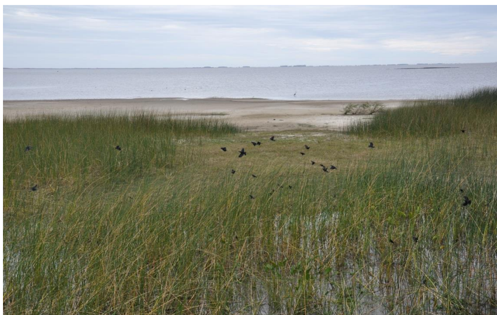
Figura 4: Balneário do Porto – Santa Vitória do Palmar - RS

Na Zona Costeira - Litoral Sul, do total de 60 análises, 98 % foi classificado na condição PRÓPRIA, e apenas o balneário em Pedro Osório, no rio Piratini, apresentou 01 registro na condição imprópria, Todos os resultados da temporada podem ser visualizados na Tabela 4.