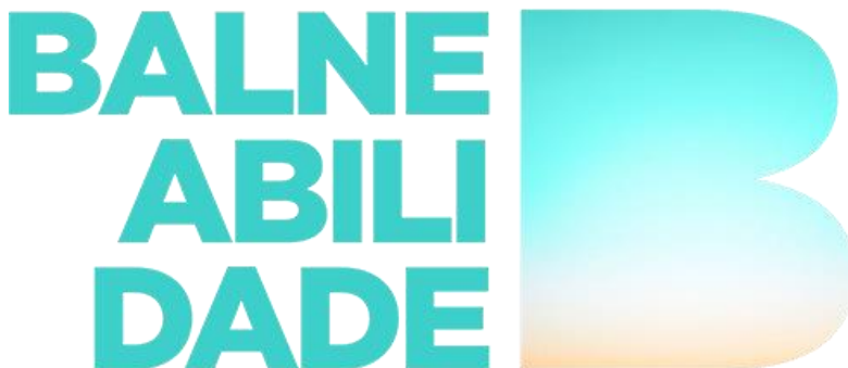
Figura 5: Logotipo do aplicativo BALN