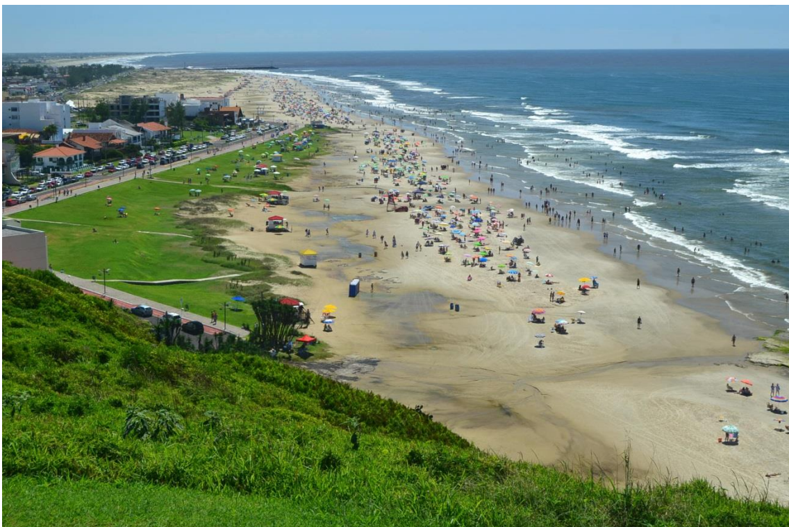
Figura 3: Torres RS

Na Zona Costeira - Litoral Norte, do total de 420 análises, 99,76 % foi classificado na condição PRÓPRIA e somente um balneário na condição imprópria (Praia de Magistério, no Balneário Pinhal). Todos os resultados da temporada podem ser visualizados na Tabela 2.