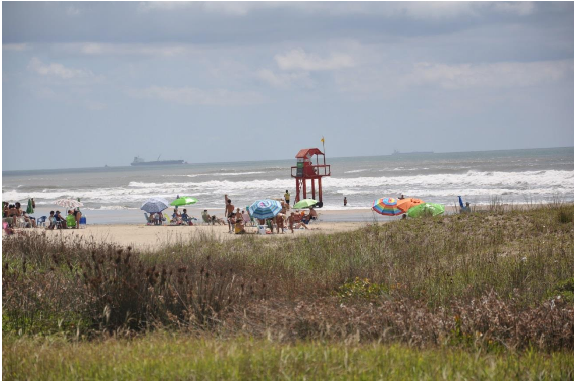
Figura 2: Tramandaí - RS